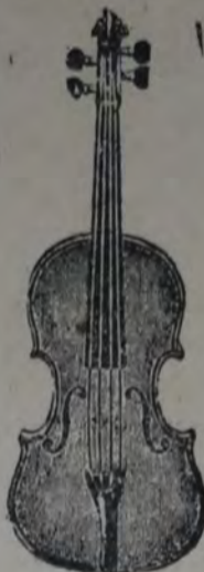
VIOLIN, modelo conservatorio, hecho con maderas estacionadas, desde $ 25