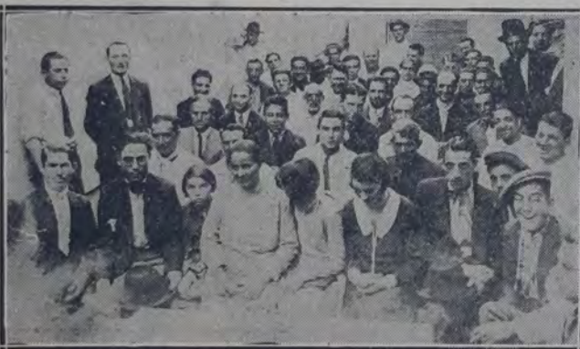
Parte de los huelguistas del gremio de empajadores, reunidos en asamblea

Nuestro gremio ha sufrido toda clase de humillaciones y rebajas de salarios que los patronos han querido