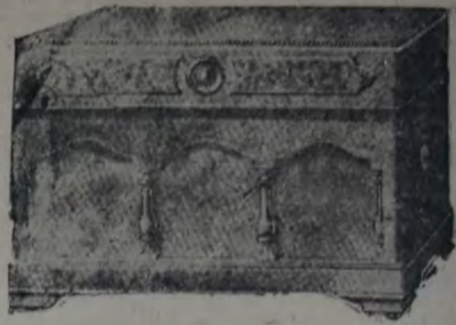
GRAMOFONO de lujosa presentación construido con maderas especiales y lustrado a mano, color nogal lustroso, frente artísticamente adornado con columnas de ébano. Bocina interna Semi-Teofónica. Con máquina de dos cuerdas y membrana especial. Medidas de la caja: 45 por 29 por 36 cms. $ 140; otro, $ 55